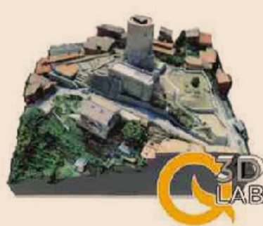
Plastico in stampa 3D

Concludendo, Q3D LAB è un'importante risorsa presente sul territorio italiano, aperta ai più svariati settori, in cui l'interazione delle diverse tecnologie utilizzate, consente di offrire servizi 3D a 360°.