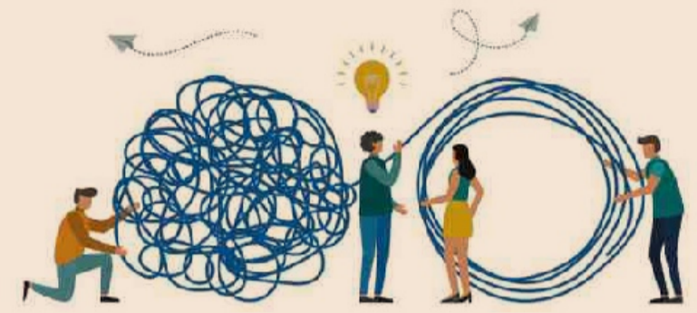
Governare la complessità per attivare il processo di sviluppo locale

sviluppo agiamo sull'interazione di alcuni elementi chiave: il rapporto pubblico-privato; le relazioni di rete fra operatori economici, il rapporto con il mondo. La gestione di queste relazioni è la vera essenza del Destination Management. Si tratta di modelli collaborativi che non nascono spontaneamente e vanno pertanto costruiti applicando un metodo rigoroso.