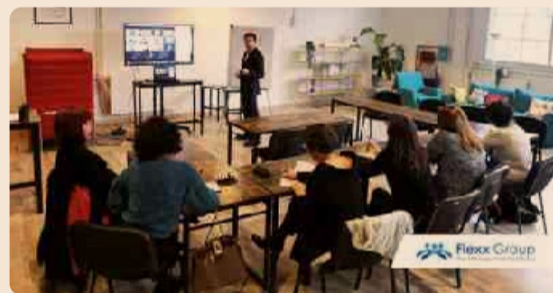
Incontro docenti e coach Flexx Academy per la progettazione di attività formative