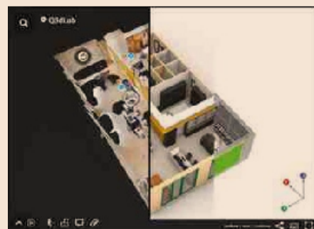
Tour Virtuale e Modellazione 3D